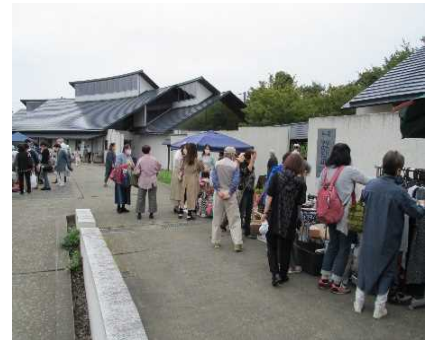
コレクションビレッジ「蚤の市」