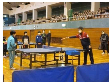
卓球レベルアップ講習会