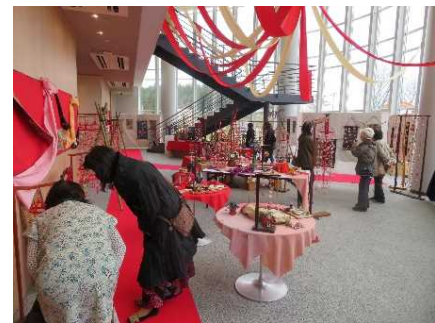
西山ふるさと公苑「つるし雛かざり」