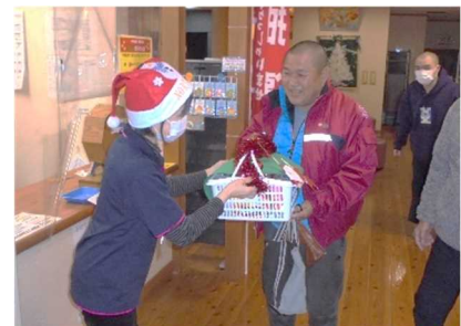
クリスマスガラポン大会