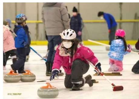
アイスリンク感謝デー カーリング体験