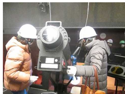
アルフォーレ バックステージツアー

体験活動事業として、大ホールの舞台や客席上部の天井裏、ピンルームなど、普段は入れない施設の舞台裏を見学して回る「冬休みアルフォーレバックステージツアー」を開催しました。当日は小学生の親子連れを始め、興味を持たれた方々が多数参加され、施設に関心を持っていただく機会を提供しました。