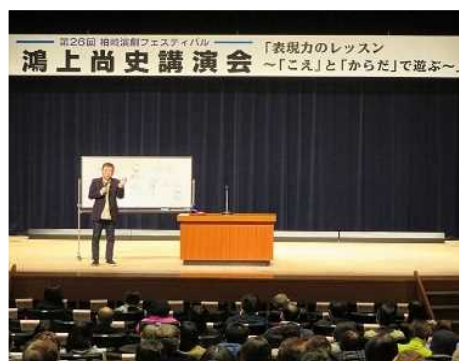
柏崎演劇フェスティバル講演会

また、新潟県文化振興財団と連携した事業を実施し、地域の文化振興に寄与するとともに、芸術鑑賞の機会を提供しました。