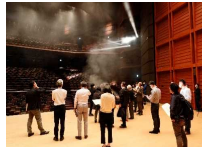
大ホール換気検証実験