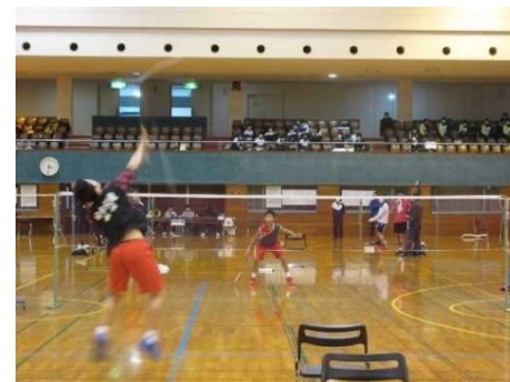
高校バドミントン交流会