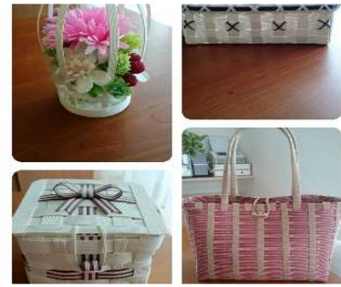
カルチャー教室「クラフトバンド」