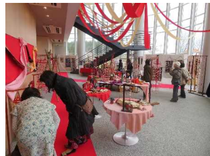
西山ふるさと公苑「つるし雛かざり」