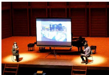
池辺晋太郎の音楽の不思議 「文化とスポーツの出会い」 トーク&コンサート

令和2年度の主催・共催事業は、コロナ禍の折、延期や中止が相次ぐ中、ホール内の適切な間隔を取るなど、お客様への安全対策を最優先とし、牛田智大ピアノ・リサイタルほか、5つの主催事業を行いました。各種団体と連携した共催事業は協議の結果、今年度は残念ながら開催に至りませんでした。また、柏崎古典フェスティバルでの「ワンコインで楽しむ日本の伝統楽器『箏と尺八の響き』」の公演会場については、「三密」を避けマルチホールから大ホールへと変更いただきました。