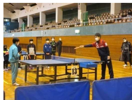
卓球レベルアップ講習会