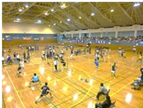
財団カップ争奪高校生バドミントン大会