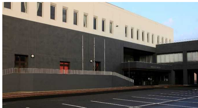
(産業文化会館外観)