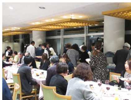
海洋センター（雷音） ボジョレー&ディナーパーティ