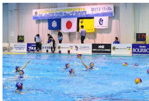
全日本ジュニア(U17)水球競技選手権大会