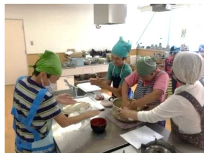
西山自然体験交流施設ゆうぎ 「郷土料理づくり教室」

番神・東の輪海水浴場に隣接する柏崎海浜公園や西山町の自然体験交流施設ゆうぎの環境整備を行うとともに、公園に付帯する駐車場の管理、キャンプ場施設の管理運営を行い利用者に安全で快適な施設貸与を行いました。