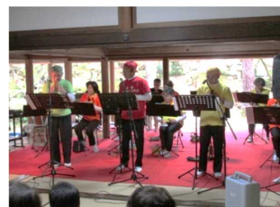
史跡・飯塚邸 「柏崎コカリナクラブコンサート」

地域の歴史的・文化的に貴重な建築物、庭園等の保存を行うとともに、当時の生活用具や代々伝わる名器の展示を行いました。また、旧家の日本間や日本庭園を利用した呈茶会などの体験機会を提供しました。