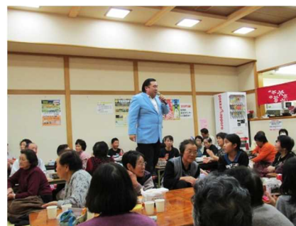
大崎温泉 雪割草の湯 「開館10周年イベント」